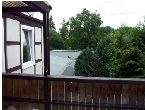
Ausblick zum See