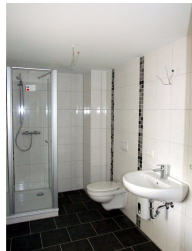
Bad mit Dusche