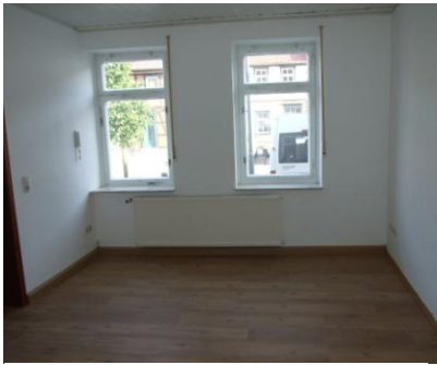
Ausblick Wohnzimmer in Richtung Straße