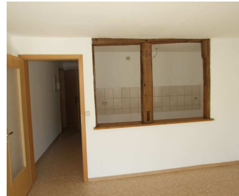
Wohnzimmer mit Durchreiche