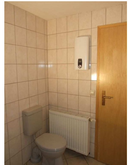
Badewanne mit Dusche