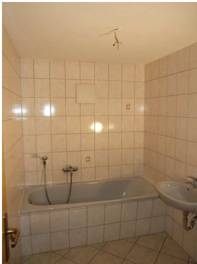
Bad mit Wanne und WC