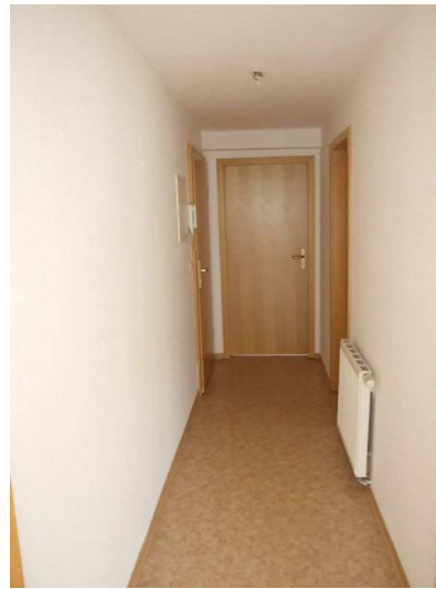
Flur in Richtung Schlafzimmer