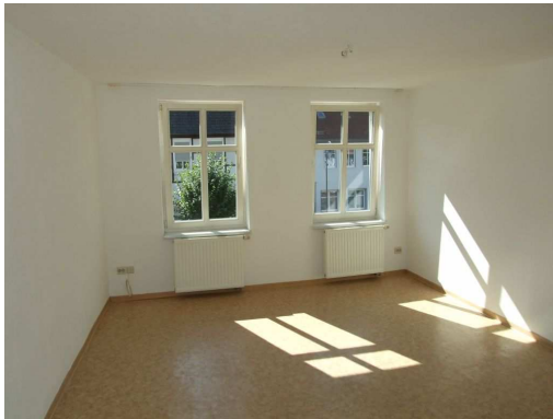
Ausblick Wohnzimmer in Richtung Straße